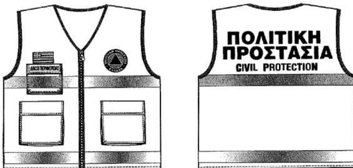
Εικόνα 2. Επιχειρησιακά γιλέκα Πολιτικής Προστασίας

Αναλυτικές προδιαγραφές για την εμφάνιση των επιχειρησιακών μπουφάν και γιλέκων Πολιτικής Προστασίας δίνονται στο 4678/22-11-2004 έγγραφο ΓΓΠΠ.