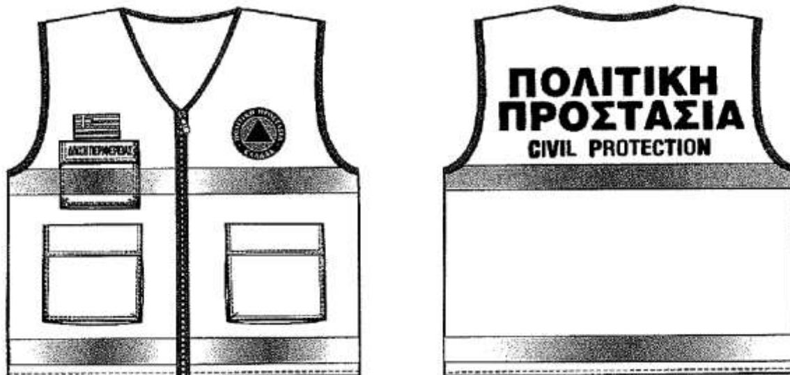
Εικόνα 2. Επιχειρησιακά γιλέκα Πολιτικής Προστασίας

Αναλυτικές προδιαγραφές για την εμφάνιση των επιχειρησιακών μπουφάν και γιλέκων Πολιτικής Προστασίας δίνονται στο 4678/22-11-2004 έγγραφο ΓΓΠΠ.