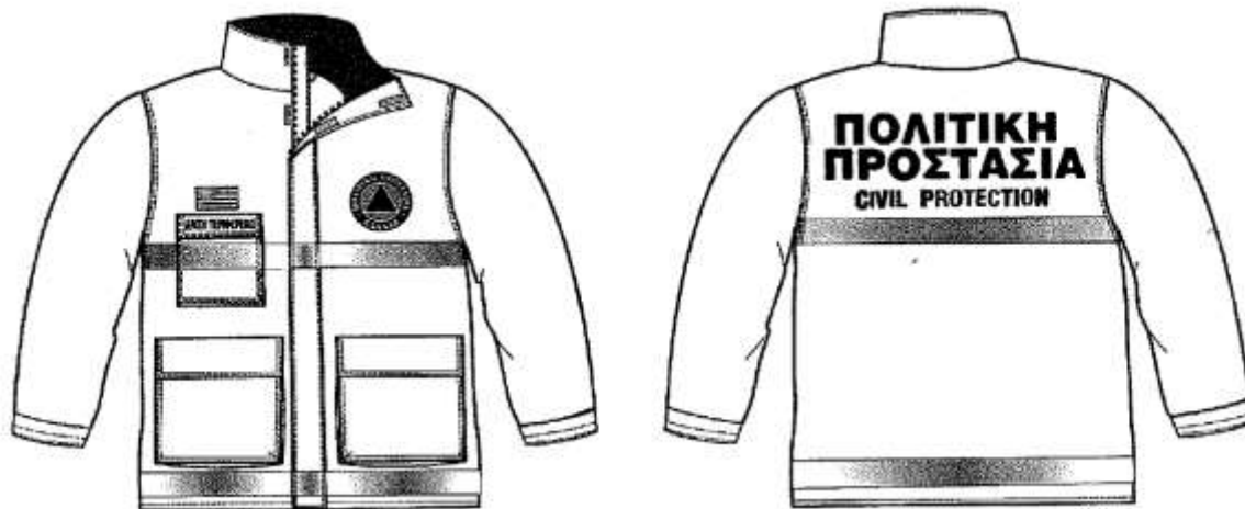
Εικόνα 1. Επιχειρησιακά μπουφάν Πολιτικής Προστασίας

Σύμφωνα με το 4678/22-11-2004 έγγραφο ΓΓΠΠ, τα επιχειρησιακά μπουφάν Πολιτικής Προστασίας θα πρέπει να έχουν την ακόλουθη μορφή: