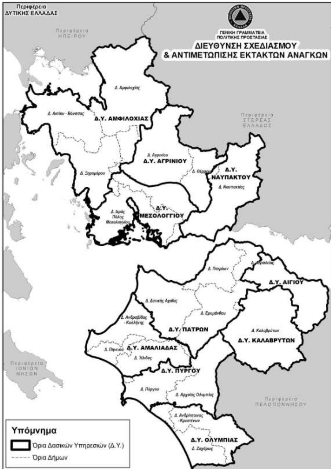
Πίνακας 1: Χαρτογραφική αποτύπωση τα διοικητικά όρια των Καλλικρατικών Δήμων.