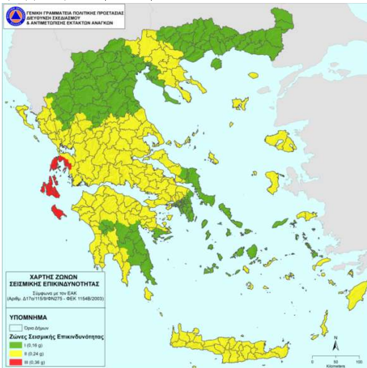
Εικόνα 2. Χάρτης ζωνών σεισμικής επικινδυνότητας σε σχέση με τα όρια των Δήμων της χώρας.

Σύμφωνα με την τελευταία τροποποίηση του ανωτέρω Χάρτη (ΥΑ Δ17α/115/9/ΦΝ275/7-8-2003, ΦΕΚ 1154 Β) ο Ελληνικός χώρος κατανέμεται σε τρεις Ζώνες Σεισμικής Επικινδυνότητας με αντίστοιχες τιμές ενεργών εδαφικών επιταχύνσεων σχεδιασμού 0,16 g για την πρώτη ζώνη, 0,24 g για τη δεύτερη ζώνη και 0,36 g για την τρίτη ζώνη. Η κατανομή των ζωνών αυτών παρουσιάζεται στο χάρτη της εικόνας 1. Στον χάρτη της εικόνας 2, παρουσιάζονται οι ζώνες σεισμικής επικινδυνότητας σε σχέση με τα όρια των Δήμων της χώρας, σύμφωνα με τα όσα προβλέπονται στην Υπουργική Απόφαση Δ17α/115/9/ΦΝ275/7-8-2003 (ΦΕΚ 1154 Β).