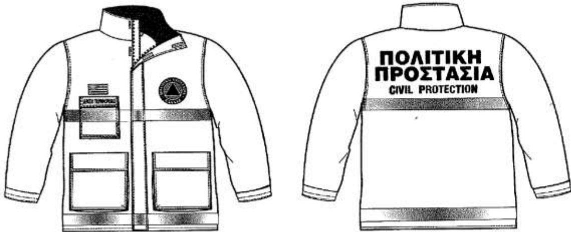
Εικόνα 1. Επιχειρησιακά μπουφάν Πολιτικής Προστασίας

Σύμφωνα με το 4678/22-11-2004 έγγραφο ΓΓΠΠ, τα επιχειρησιακά μπουφάν Πολιτικής Προστασίας θα πρέπει να έχουν την ακόλουθη μορφή: