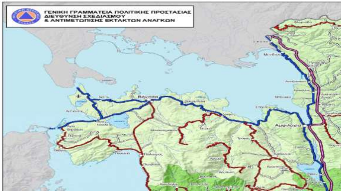
Πίνακας2: Χαρτογραφική αποτύπωση του οδικού δικτύου του Δήμου Ακτίου-Βόνιτσας, σύμφωνα με το υπ' αριθμ. 7910/8-11-2017 . Η αρμοδιότητα παρέμβασης των φορέων, έχει καθοριστεί με την υπ' αριθμ. ΔΜΕΟ/ε/0/268 Υπουργική Απόφαση, « Ανακατάταξη Επαρχιακού Οδικού Δικτύου των Νομών της Χώρας». (ΦΕΚ 293 Β'/17-04-1995)

Στην Περιφέρεια Δυτικής Ελλάδας, η αρμοδιότητα συντήρησης των οδών, που η συντήρησή τους ανήκει στην πρώτη κρατική Περιφέρεια (Εθνικό οδικό δίκτυο) ανήκει στη Δ/νση Τεχνικών Έργων της Περιφέρειας, ενώ η αρμοδιότητα συντήρησης των οδών, που η συντήρησή τους ανήκει στις πρώην Νομαρχιακές Αυτοδιοικήσεις (Επαρχιακό οδικό δίκτυο) ανήκει στις Δ/σεις Τεχνικών Έργων των αντίστοιχων Περιφερειακών Ενοτήτων της Περιφέρειας. Διευθύνουσες Υπηρεσίες για τα έργα και τις δράσεις χειμερινής συντήρησης είναι τα Τμήματα Συγκοινωνιακών Έργων της Περιφέρειας και των Περιφερειακών Ενοτήτων αντίστοιχα ενώ Προϊσταμένη Αρχή είναι η Οικονομική Επιτροπή της Περιφέρειας (244912/1086/11-10-2012, έγγραφο της Δ/σης Πολ. Προστ. Περιφέρειας Δυτικής Ελλάδας).