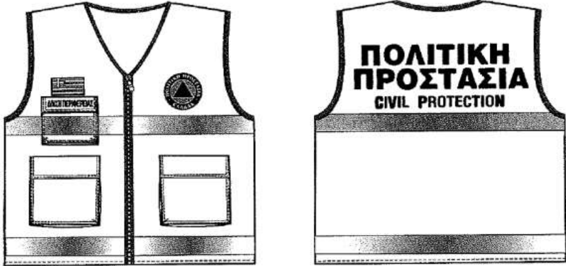
Εικόνα 2. Επιχειρησιακά γιλέκα Πολιτικής Προστασίας

Αναλυτικές προδιαγραφές για την εμφάνιση των επιχειρησιακών μπουφάν και γιλέκων Πολιτικής Προστασίας δίνονται στο 4678/22-11-2004 έγγραφο ΓΓΠΠ.